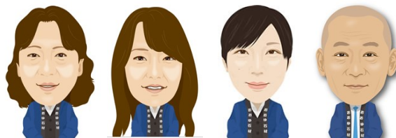
じん おかざき よこやま みかみ

大正12年以来、津軽の皆さまとご一緒に歩んでまいりました。石やお墓のある、豊かな暮らしを、お手伝いしてまいります。