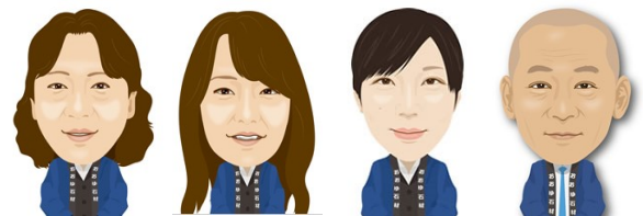
じん おかざき よこやま みかみ

大正12年以来、津軽の皆さまと一緒に歩んでまいりました。石やお墓のある、豊かな暮らしを、お手伝いしてまいります。